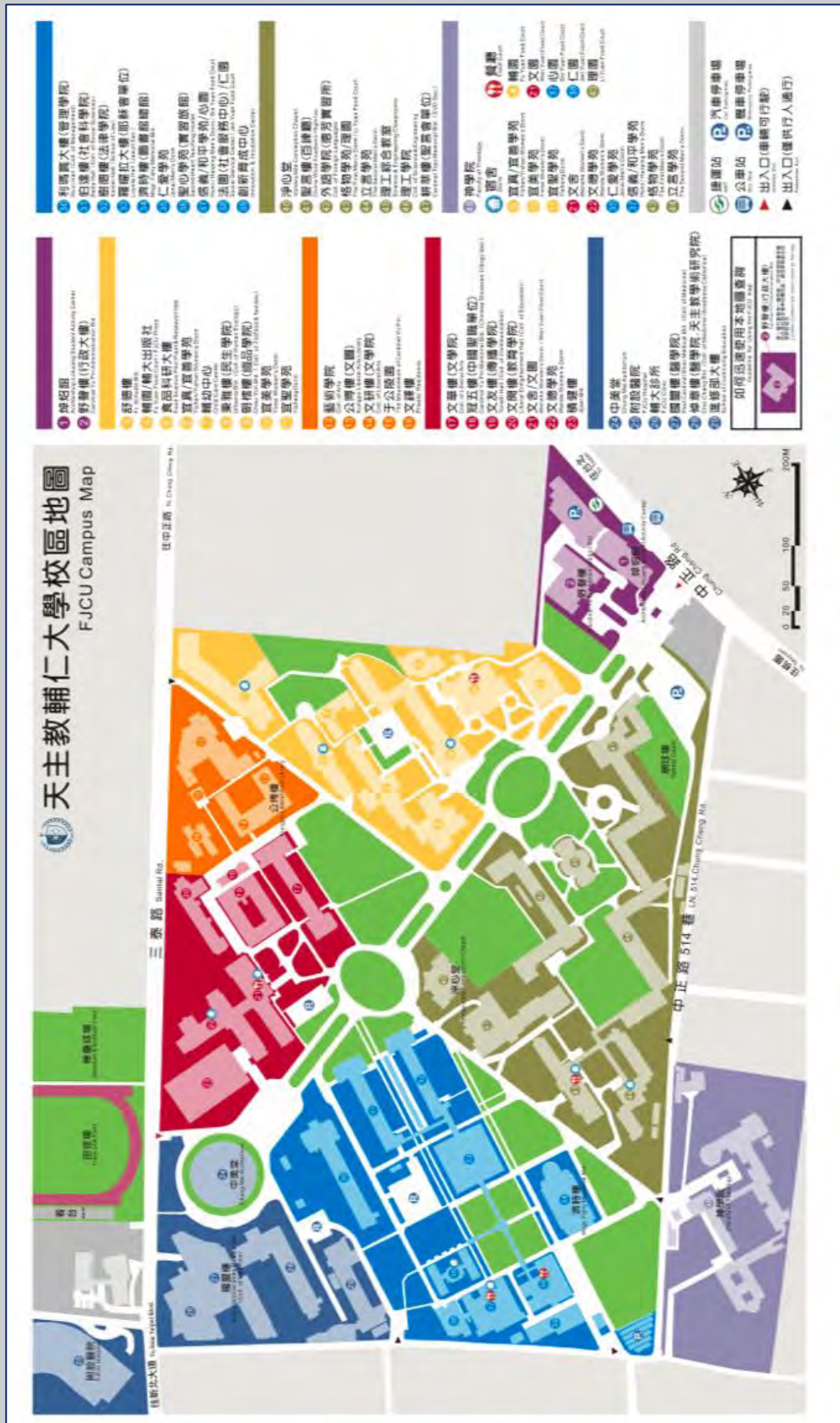
附：天主教輔仁大學校區地圖