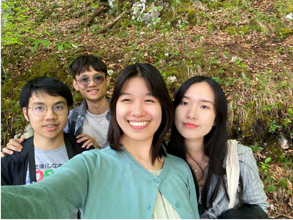
去英國找在當地交換和讀研的朋友