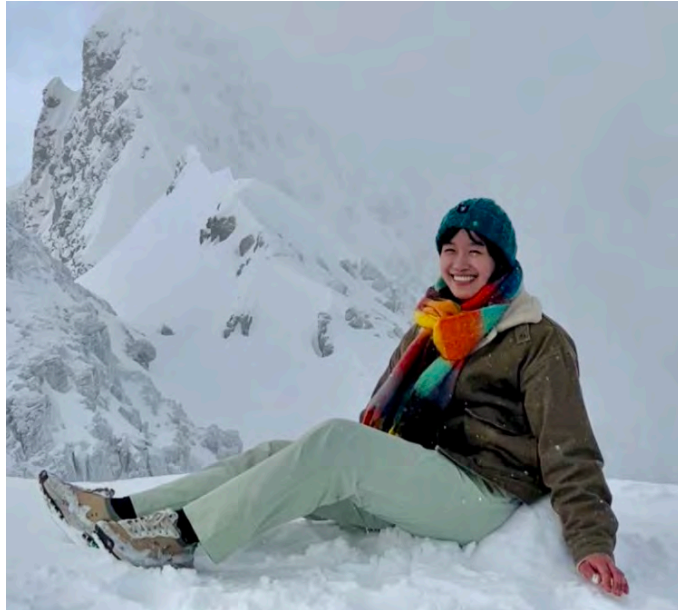
體驗了一輪完整的春夏秋冬