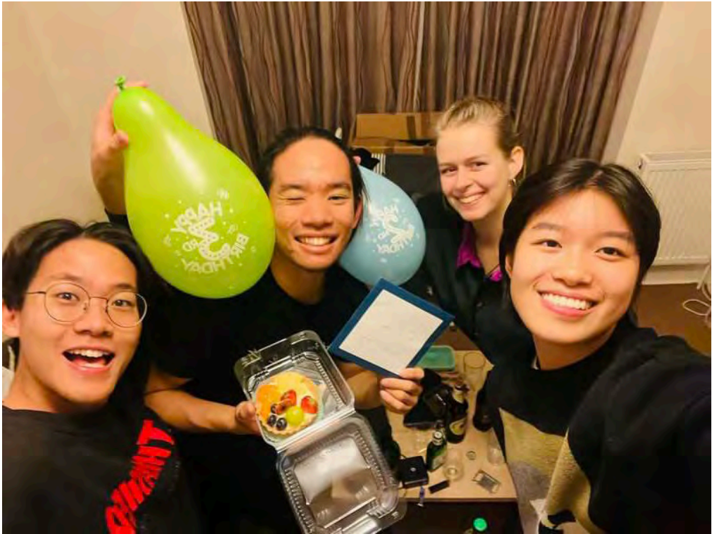
去德國找在當地讀研的朋友