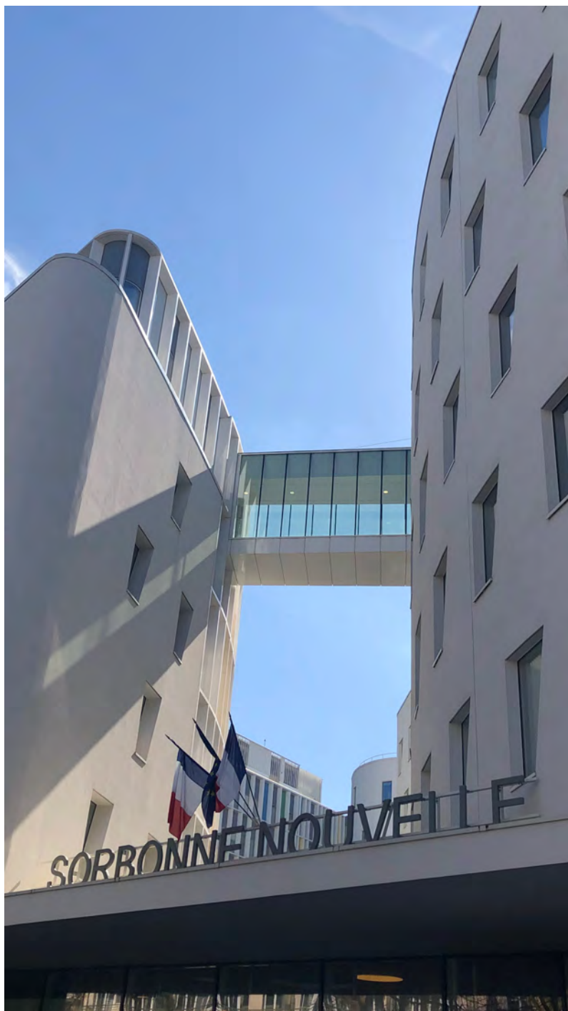
(巴黎第三大學的校門口)

極富盛名。由於法文系上有兩位教授是這所學校畢業的博士，所以從大一入學開始，我們就對於巴黎第三大學的校名非常熟悉。值得一提的是，於2013年10月啟動的新校區工程將分散的十二個校區重新合併在一起，因此現今的校區建築十分現代，教室、講堂和學生餐廳都很舒適，身為交換學生的我非常喜歡我們學校的環境。