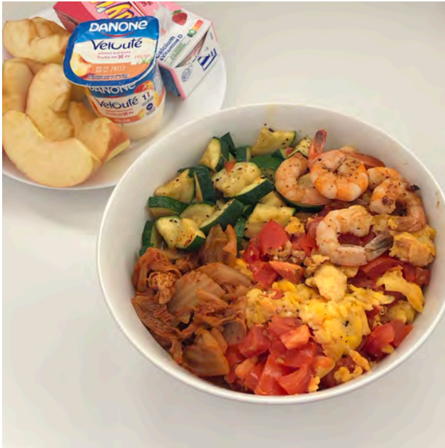
( 櫛瓜、蝦仁和番茄炒蛋 )