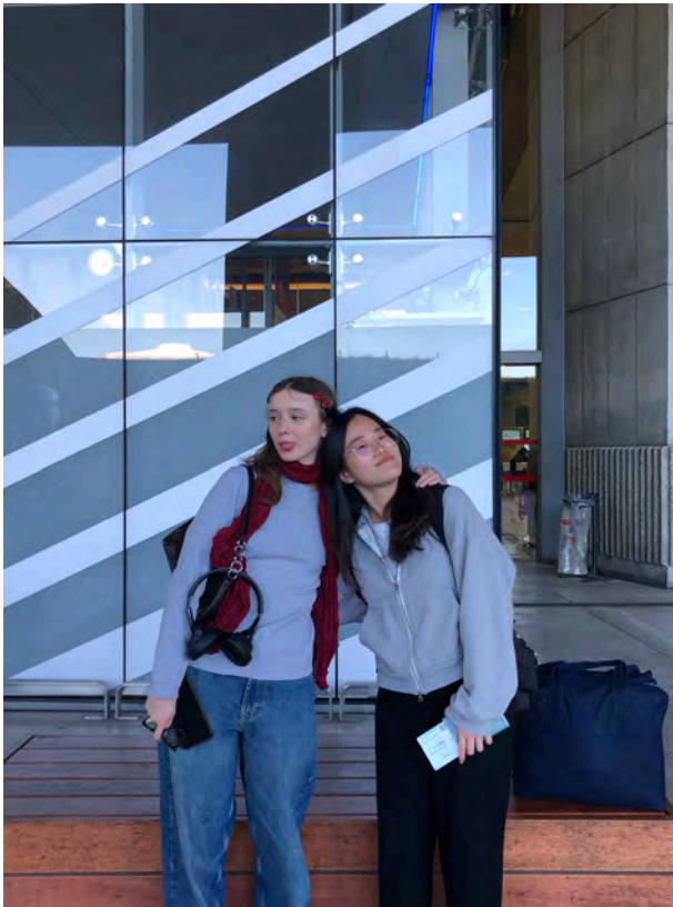
(回台灣那天好朋友送我去機場)

卡繆在《薛西弗斯的神話》寫到「朝向山頂的戰鬥本身就足以充實人心。」("Le combat vers les sommets suffit à remplir un cœur.") 選擇出國交換一年是我做過最正確的決定之一。這一年遇見的所有人都對我產生了許多積極且正面的影響。從初入法國時的緊張和陌生，到獨自在歐洲旅行時的愜意，再到法國朋友聚會上交流的游刃有餘，這一年我真的在人生的各方面都成長了不少。身處異鄉的寂寞和生活上的磨難都是促使我直面自己的考驗，因此如今回想起來，剩下的只有美好的回憶和無限的感謝，畢竟一切都是最好的安排。年輕時曾在巴黎生活是我的榮幸。當初的我其實非常猶豫是否要選擇去法國交換，即使我的主修就是法文，卻更想去韓國交換，因為我清楚地知道歐洲相較於亞洲更需要時間適應和融入，但最後我還是堅定地選擇了法國，然後因為這段經歷有了相信自己的底氣。因此，我希望所有害怕未知的人都可以勇敢地踏出那一步，去迎接從未體驗過的美好和快樂。