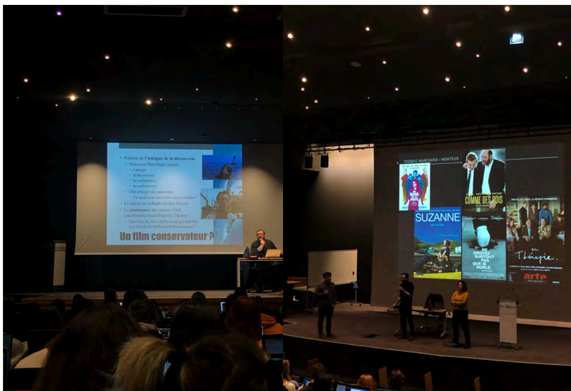
（近代電影歷史和電影職業及其發展的課堂照片）