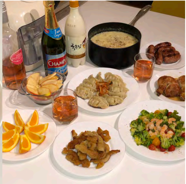
( 除夕的年夜飯 )