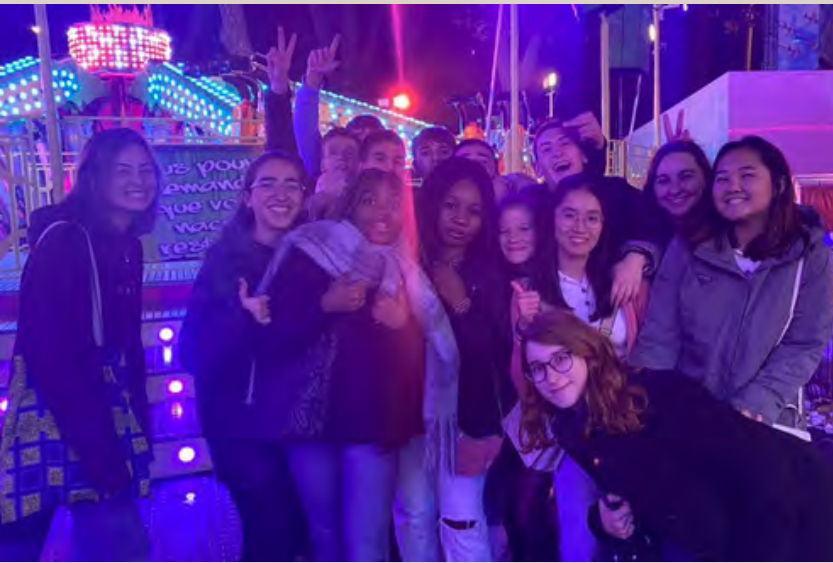
跟朋友們一起去遊樂園