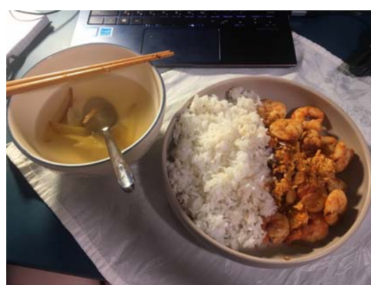
小當家薑湯和蝦仁番茄