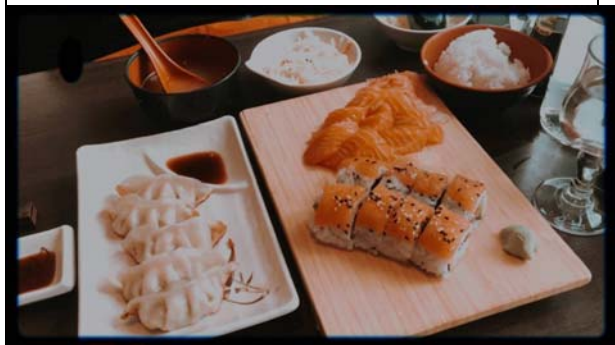
鎮上店面推薦 15 歐左右中國人開的日料 Sakura 偶爾想吃的時候會去