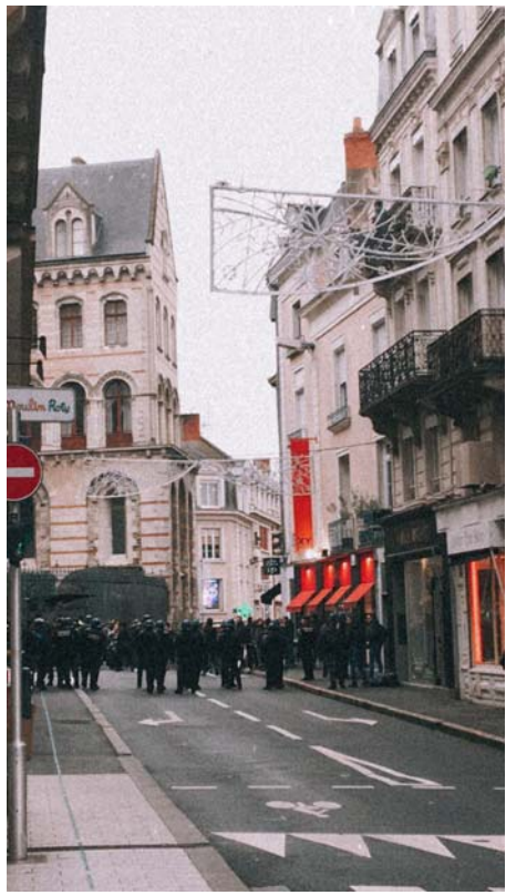
初抵 Angers 遇上罷工