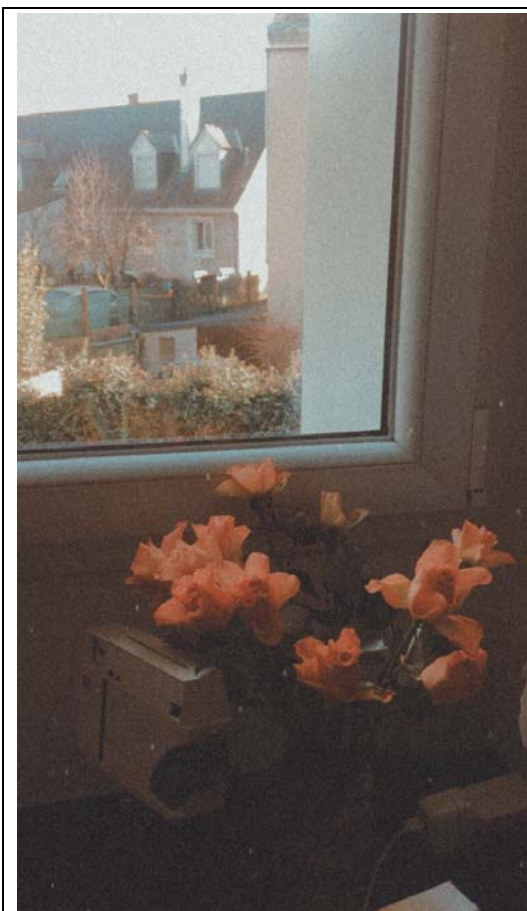
封城買花布置房間