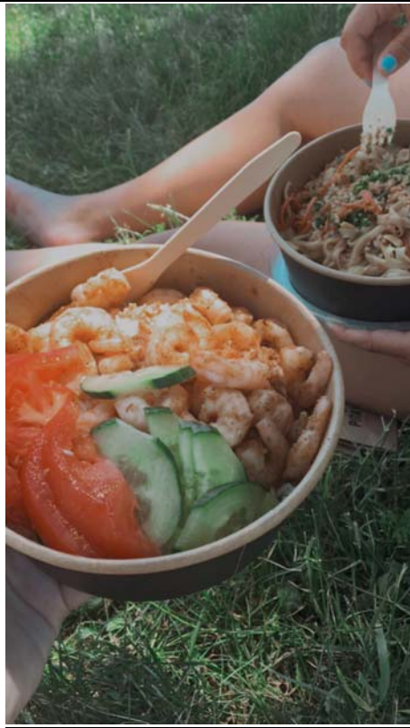
解封後不能旅遊 經常外帶 pitaya 去河邊吃完睡午覺