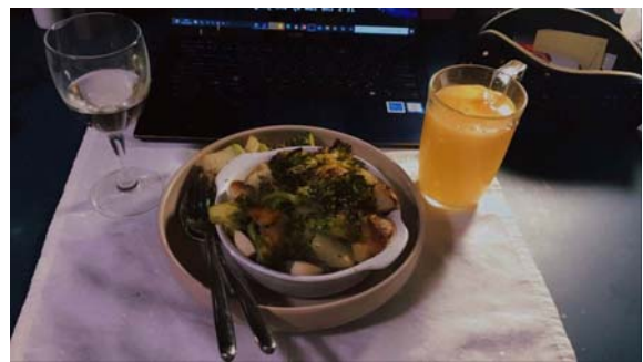
懶人每位蒜片烤馬鈴薯和花椰菜還有最愛的 couteau du layon