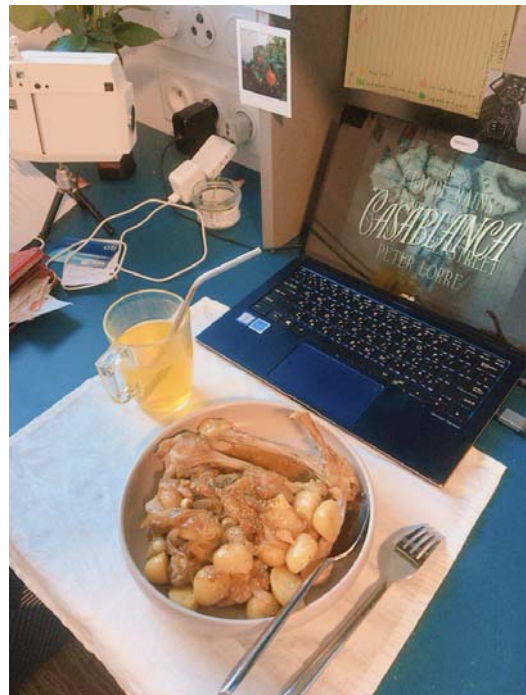
蜜汁雞(monoprix 可以幫忙去骨)