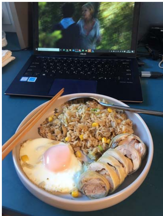
為了做給歐洲朋友吃不斷失敗的醉雞