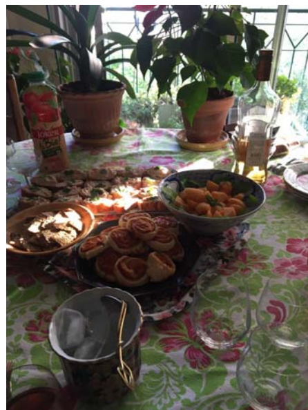
Another apéro (法國人聚會三小時起跳 我那天剛從海邊回來聊到半夜十二點多 直接講到睡著)