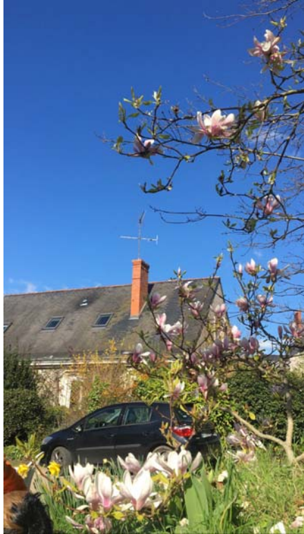
鄰居是園藝公司的 庭院很美經常去曬太陽爬樹聊天