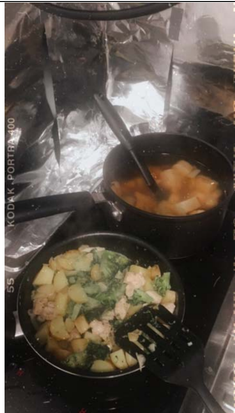
剛落地交換生集體感冒(不是肺炎)跑去看醫生然後想辦法弄養病餐