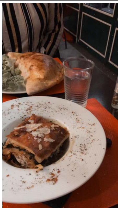
一生推的披薩店 La Toscane