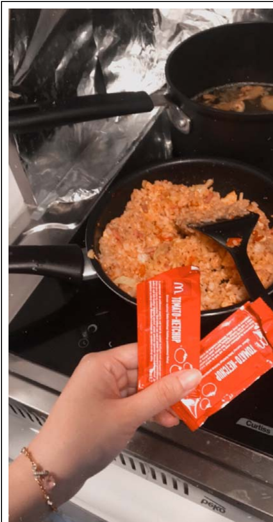
善用麥當勞番茄醬