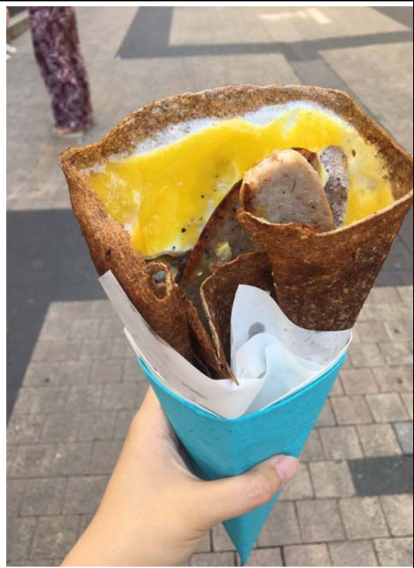
便宜好吃的可麗餅店 220celsius