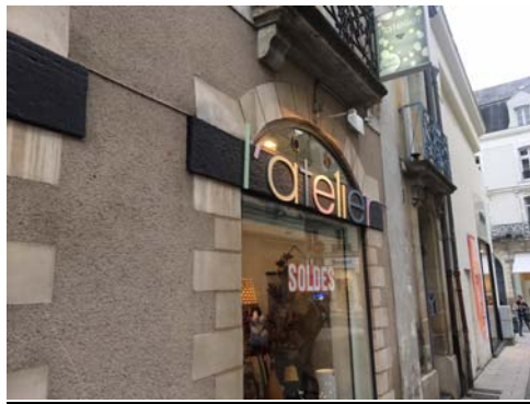
可愛家飾店 在裡面買到巴黎獨立品牌的漂亮首飾