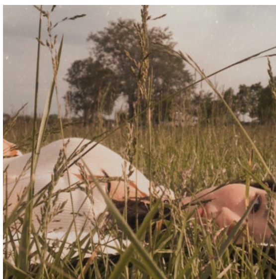
不是很想放自己的照片在網路上 別人的也有隱私權問題 以 Lac de Maine 湖畔午睡滿足醒來在草裡的自己作為查有此人 Angers 再見!我的溫柔鄉