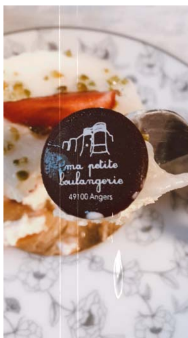
最推的麵包甜點店 請筆記