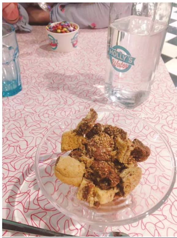
夏天之前唯一有冰淇淋的 Holly's Diner 正餐難吃