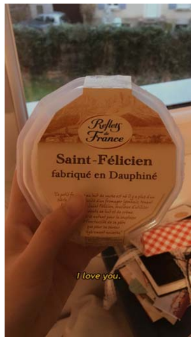
討厭起司的我在乳製品王國尋獲最愛的乳酪