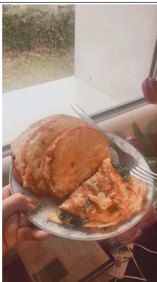
每個人出國後都會從炸廚房變小當家 尤其遇上疫情 這是炸廚房時期 和朋友徹夜排旅遊行程(疫情前)隨便煮