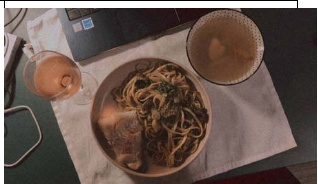
便宜好喝粉紅酒 青醬義大利麵和香煎鱈魚