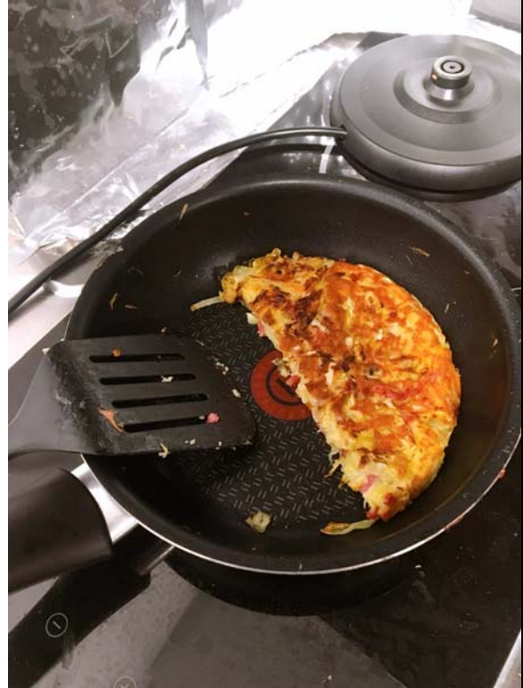
想家的高麗菜煎餅