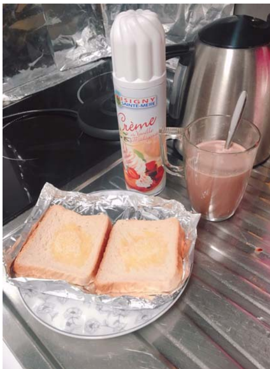
封城前期憂鬱的 eat my feelings away