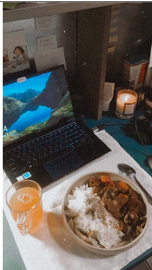
紅酒燉牛肉也做出來了