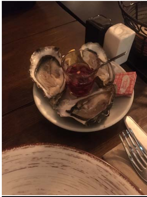
最好吃的可麗餅店(忘記拍只記得生蠔)Ker Suzette