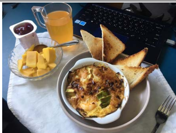
千萬不要買芒果 朋友趕著回國獲得烤箱後瘋狂試菜