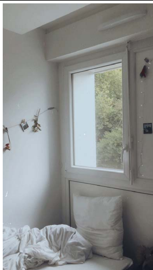
離開前一晚 我最愛的住處 永別了