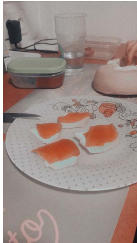
染上乳酪配果醬的發胖陋習 封城時的社交活動僅限和朋友在宿舍蹦跳