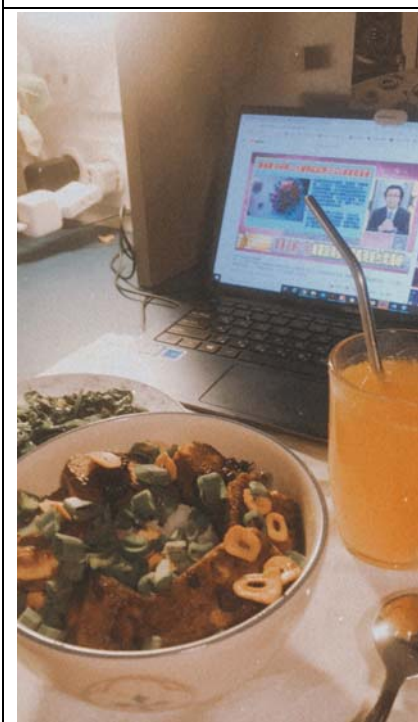
蒜片鐵板豆腐蓋飯