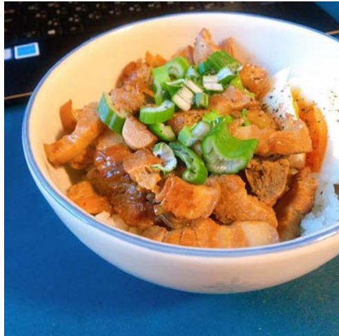
被歐洲朋友掃光光的滷肉飯