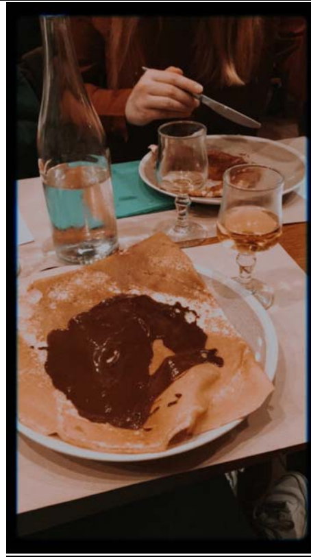
交換生歡迎會學校帶我們去吃可麗餅 (行程普遍遭受負評 個人覺得有就很好 了啦)