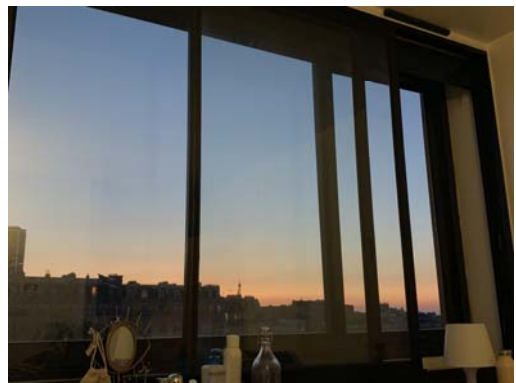
房間超大片的窗戶