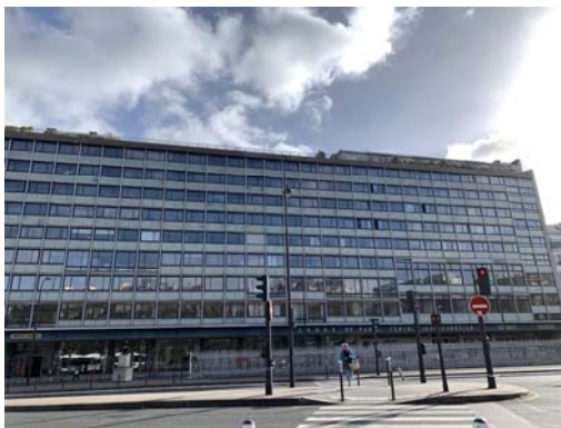
CROUS 宿舍外觀 -