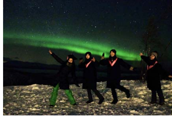
與系上友人的瑞典極光學士服