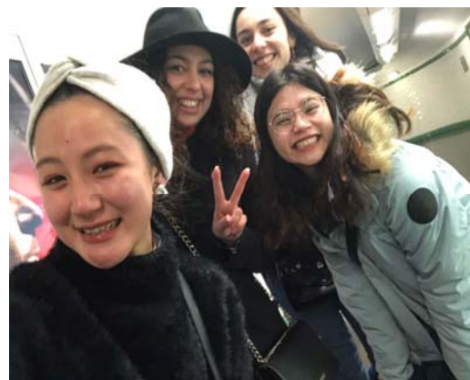
與系上友人一起和法國朋友吃晚餐