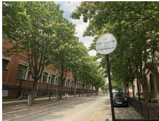
封城後美得像畫的巴黎街景