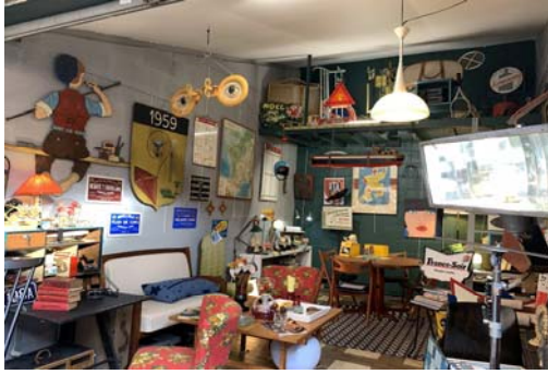
我很愛的古董市集 Paris Flea Market ( 99 Allée des Rosiers, 93400 Saint-Ouen )