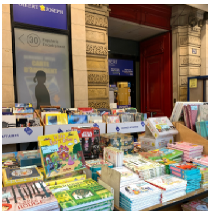
Gibert Joseph 書店 // 新書二手皆有 ( 30 Boulevard Saint-Michel, 75006 Paris)