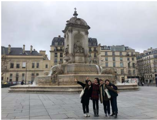
與 Art français 課堂上認識的兩位