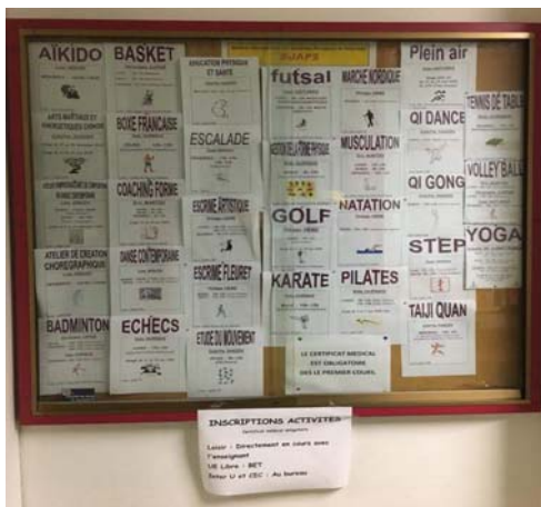
三大佈告欄上的體育課種類

escrime artistique 跟 escalade，這三堂我都很喜歡，三大的瑜珈老師每個禮拜都在訓練我們挑戰自己的極限，不僅非常重視每位學生動作的準確性，也會跟我們解釋每個動作訓練哪個部位，老師真的很用心，有時候會突然很嚴肅，但也是因為有些動作危險怕我們沒做好會受傷，上課人數非常多，建議早點去；瑜珈教室有分在學校的跟在 Crous centre sportif (離學校大約走路半小時)，但如果你是住 Crous Jean-Sarrailh 的話，可以直接選 Crous centre sportif，因為就在宿舍樓下旁的體育館，超方便的。至於擊劍跟攀岩的話，因為我覺得這是在台灣比較少會去接觸到的運動，所以我想說體驗看看。擊劍教室跟在三大的瑜珈教室是同一間，老師每個禮拜都會教一兩套新的動作，到了期末會兩兩一組，把所學的編成一套擊劍對打動作作為期末考試。至於攀岩的話攀岩場也是距離學校走路半小時路程 (在 Crous centre sportif 附近)，老師一開始會要我們暖身，教繩索操作之後，才會開始攀岩，雖然我只上了短短三次攀岩課但我非常喜歡，攀岩過程很舒壓，尤其在中途卡關上不去時，會需要逼自己找出路，等最後攻頂真的超有成就感的~~ 不得不說，三大的體育課真的蠻好玩的，推薦你們來的話可以至少選一堂試試看。