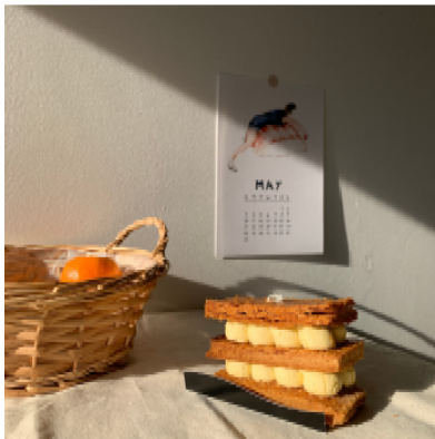
三大附近的甜點店 Carl Marletti ( 51 Rue Censier, 75005 Paris )