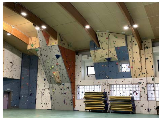
Gymnase Lavoisier 裡的室內攀岩場 (10 Rue Pierre Nicole, 75005 Paris)