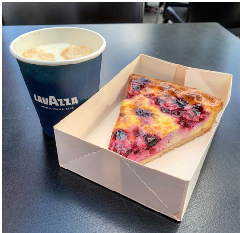
加龍河畔享用下午茶