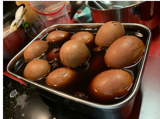
國際之夜滷的茶葉蛋