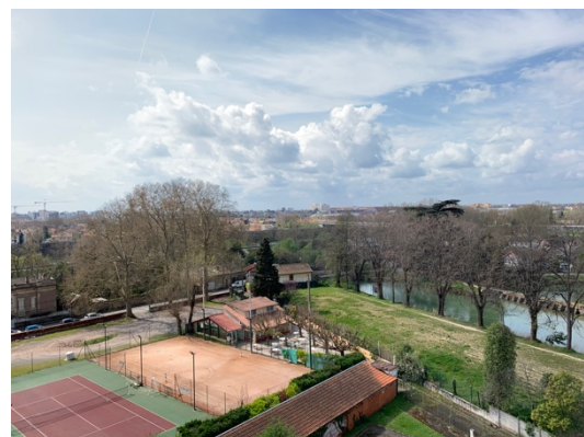
窗戶看出去的景色