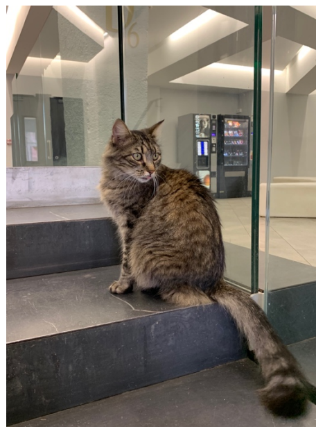
宿舍吉祥物-小肥肥