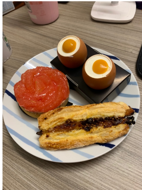
法國的甜點真的都很好吃！