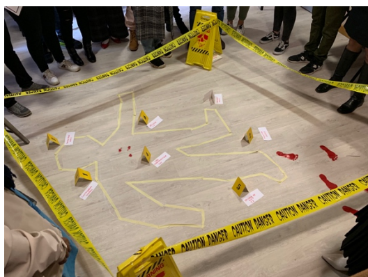
學校舉辦的逃脫遊戲