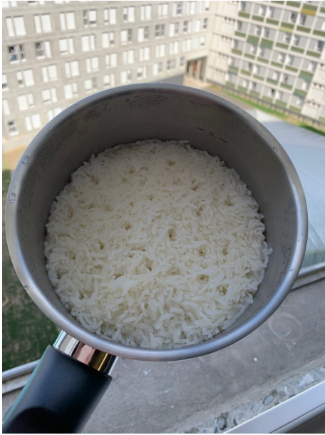
不用電鍋也能煮飯喔～