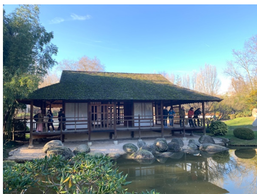
假日去日本公園散步