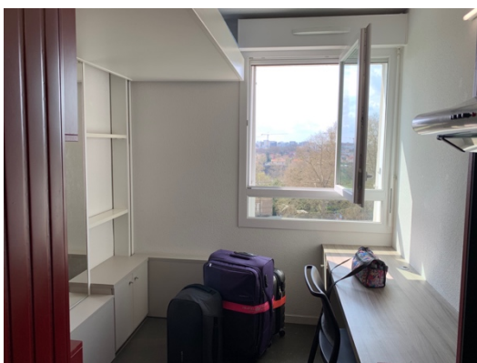
雖然小但什麼都有的房間

→ 這個問題你不用太擔心，只要第一次連接 Crous 網路的時候線上辦理一個帳號就行了，之後只要你有這個帳號你到任何一個 Crous 的宿舍都連的上網路～