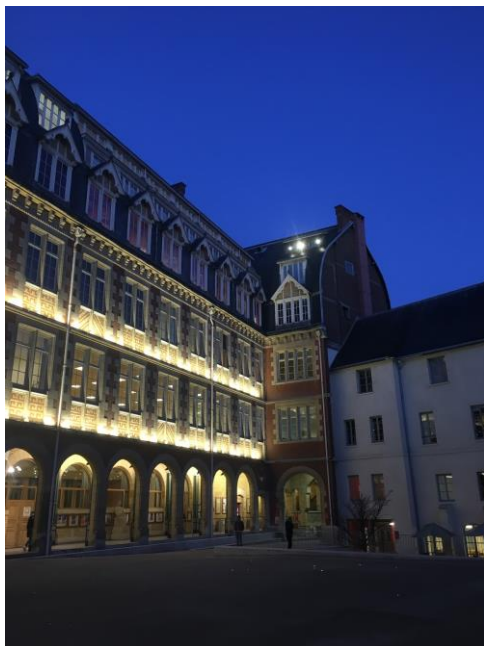
冬天早上上課的樣子