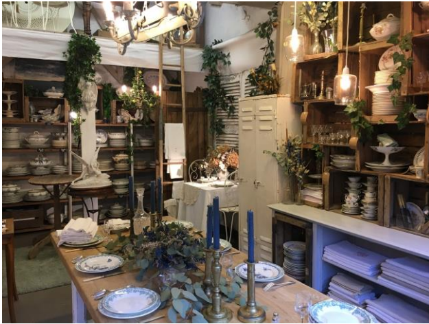
很好逛的古董市集 Marché aux puces Saint-Ouen