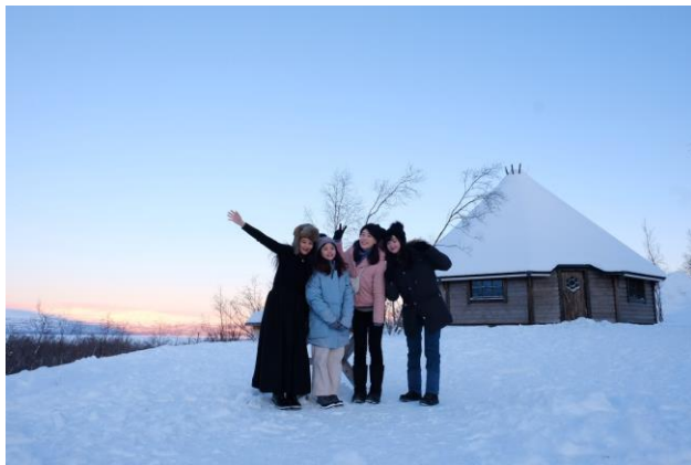
春假的時候和朋友去瑞典玩 照片中是在 Abisko