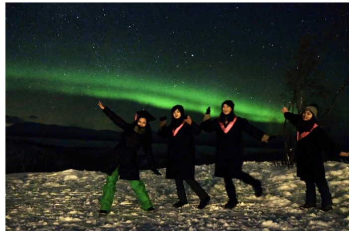
非常幸運的在 Abisko 拍到極光學士服照