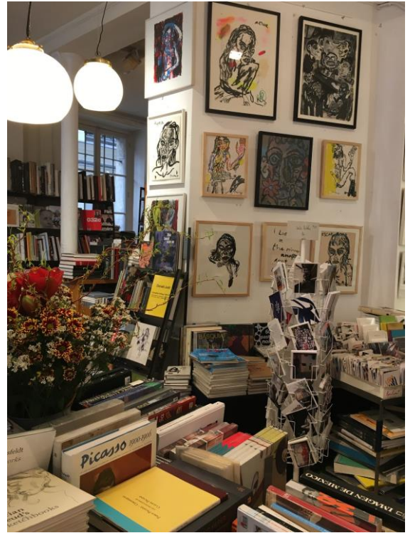
很多藝術書的書店，可以逛很久 Ofr. Librairie, galerie