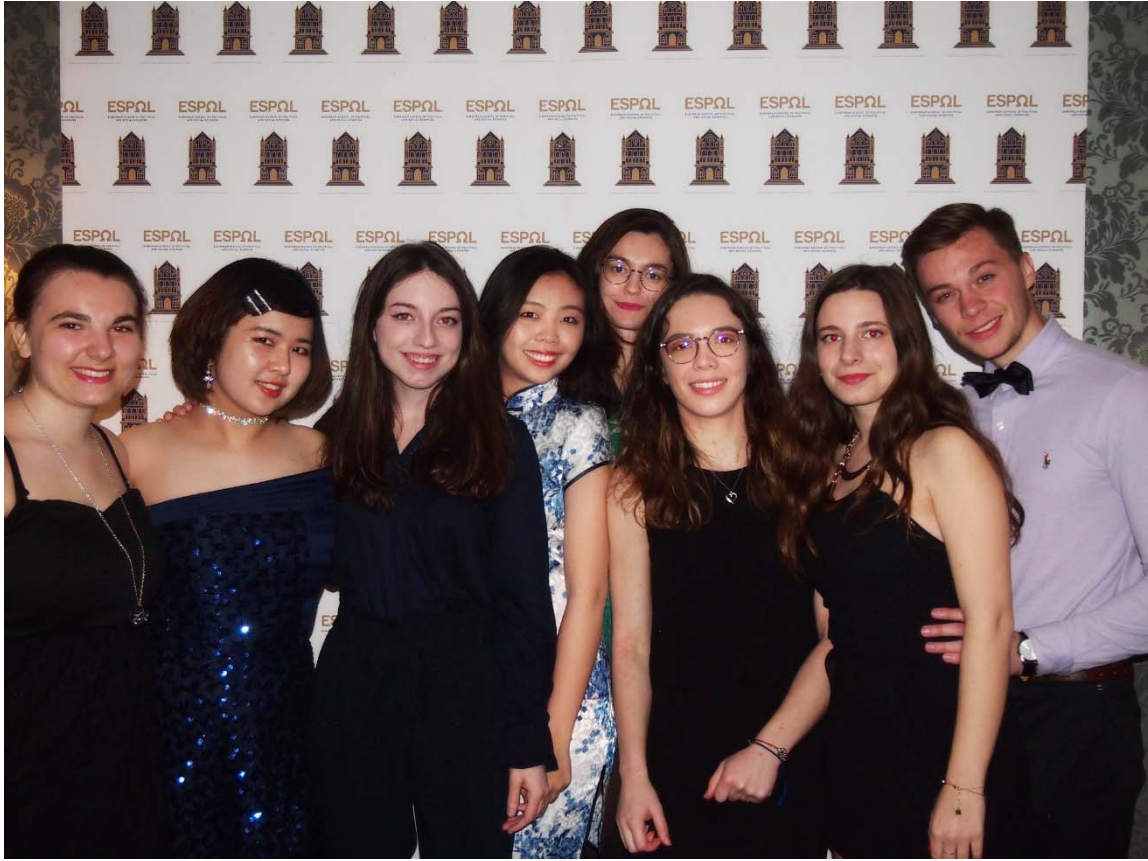
(圖一) ESPOL GALA合影