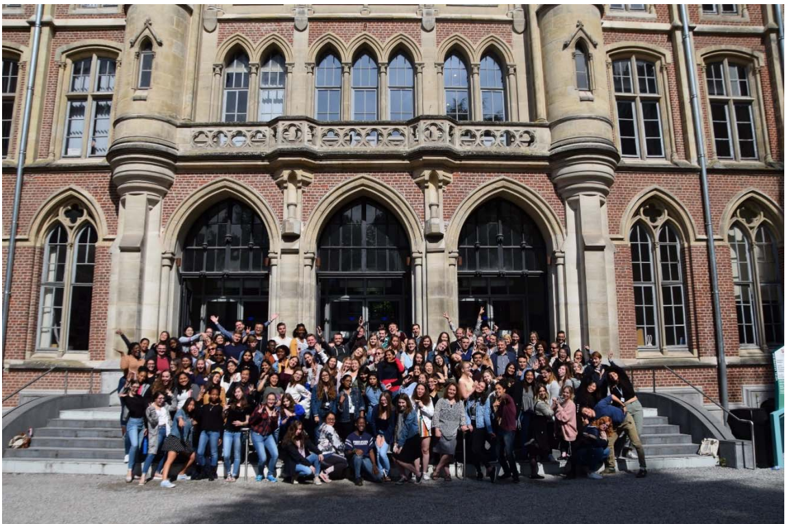
(圖二) 2019 European Summer Program 合影