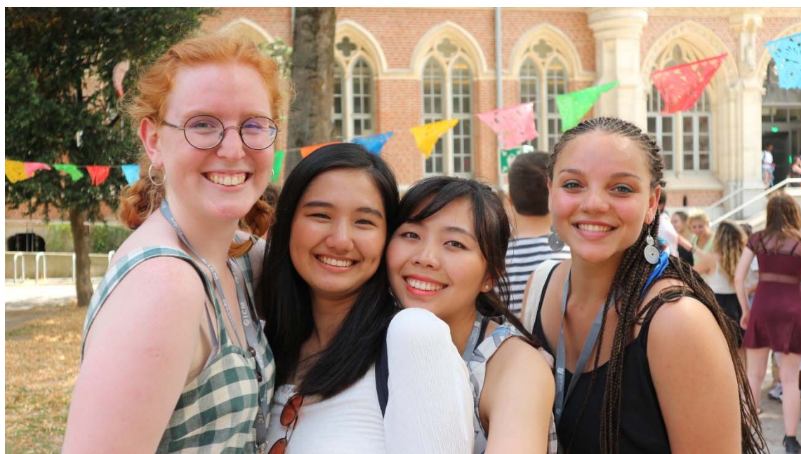
( 圖四 ) European Summer Program 結業合影