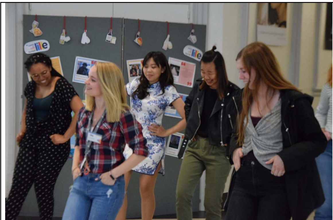
( 圖三 ) International Night 表演片段