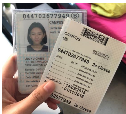
Carte de campus

如果想到鄰國旅行的話, Flixbus 和 ryanair 都是非常廉價的交通方式 !有時客運打起折來甚至有不到一歐的車票到法國或荷蘭。