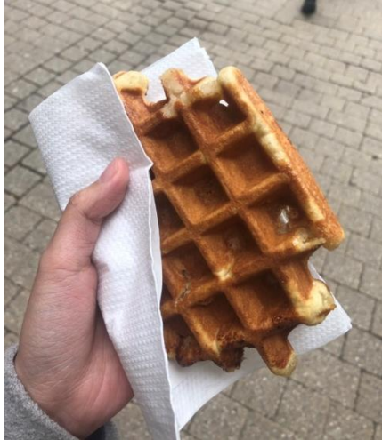
Agora 旁的超好吃鬆餅(1.5 歐)