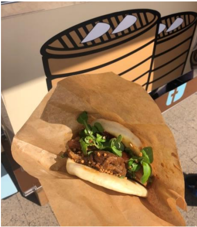
家鄉味台灣掛包(3.5 歐)