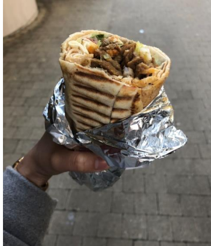
Outre mer 好吃中東捲餅(5 歐)