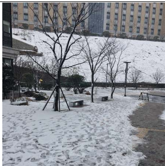
校園三月底下雪景象