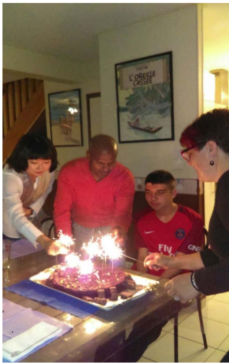
幫 home 弟過生日