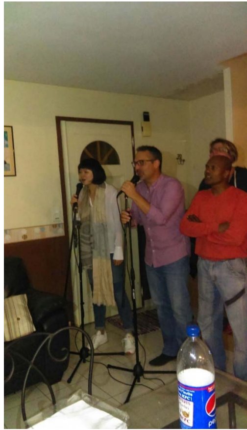
和法國家庭唱卡拉ok