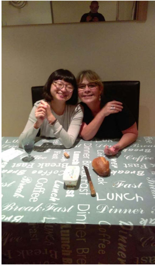
Famille d'accueil, home 媽