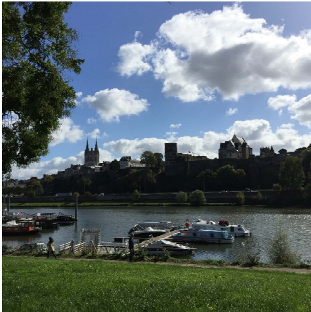
Angers , Le Quai 前的草地