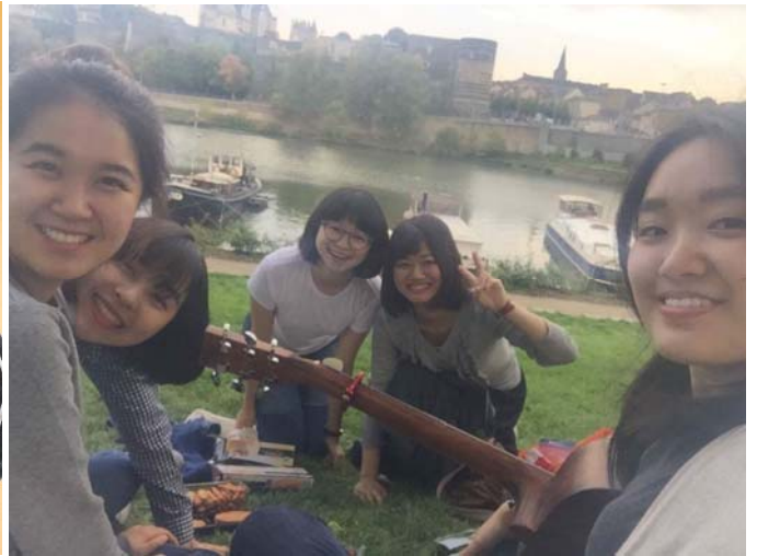
和朋友去 le quai 野餐彈吉他