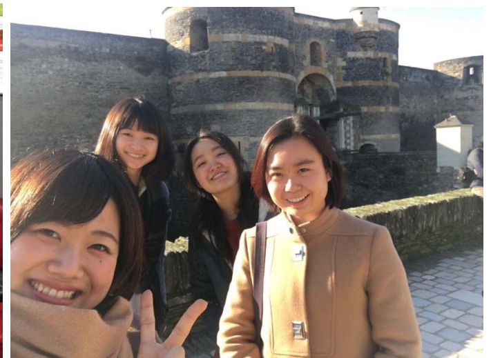
遊 Châteua d'Angers