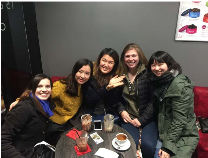
美國朋友送行茶會