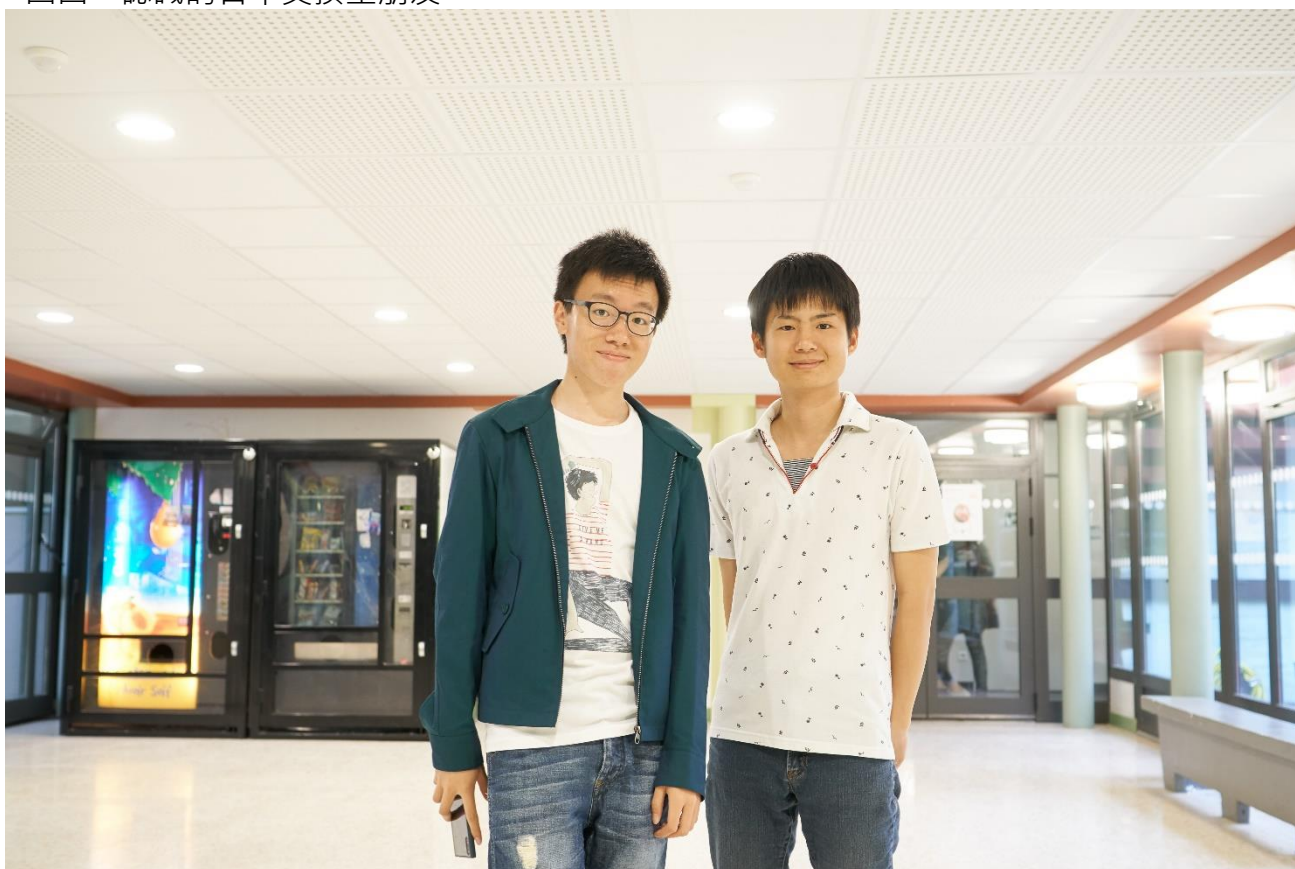
圖四、認識的日本交換生朋友