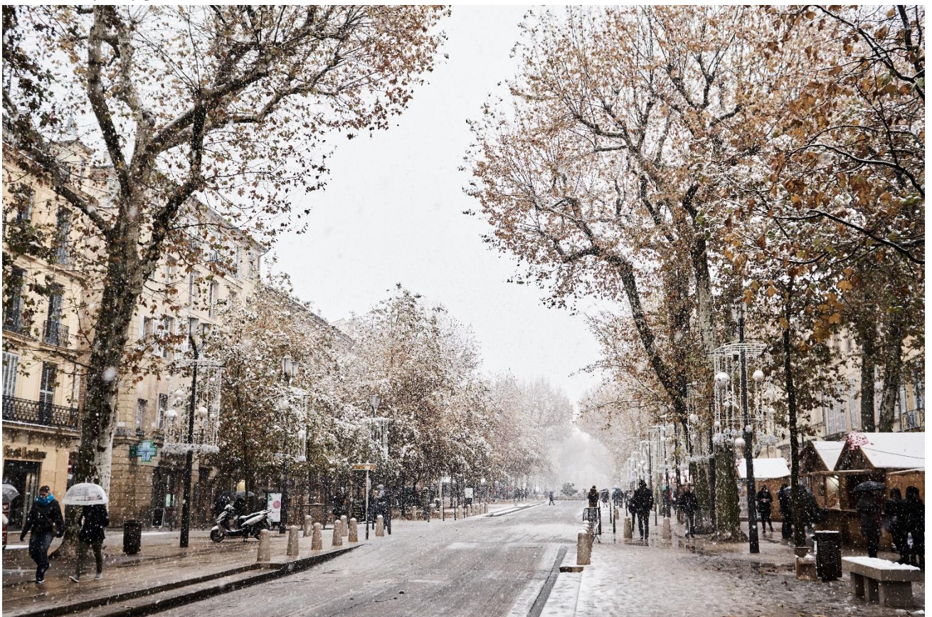
圖二、下雪的 Cours Mirabeau