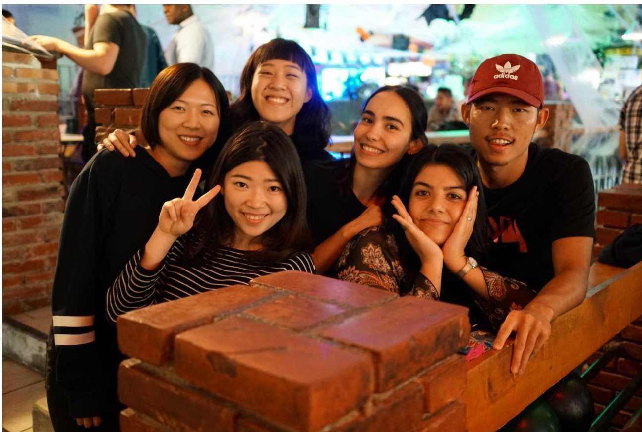
圖三、和認識的朋友打保齡球(我是掌鏡人)