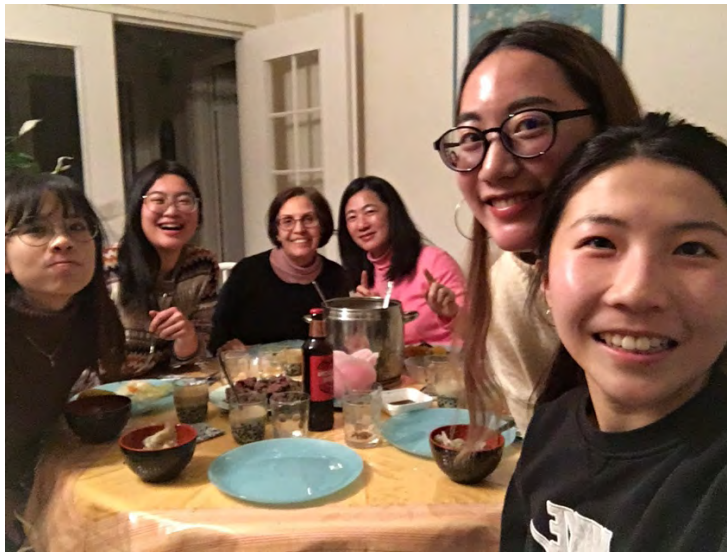
和輔大好友們的轟媽吃火鍋