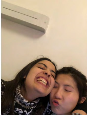
住在隔壁房的可愛伊朗室友