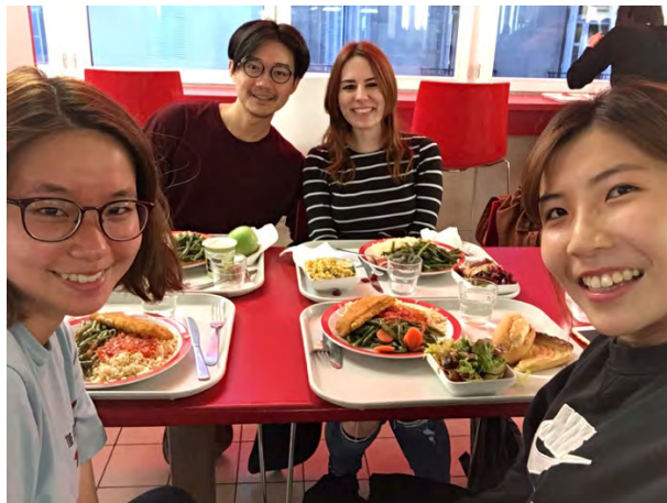
上課認識的法國人也有一個台灣男友