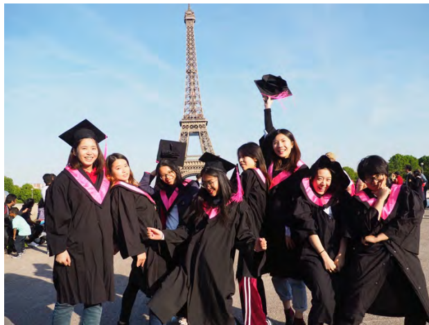
輔大法文系巧 | 九妹們 :))