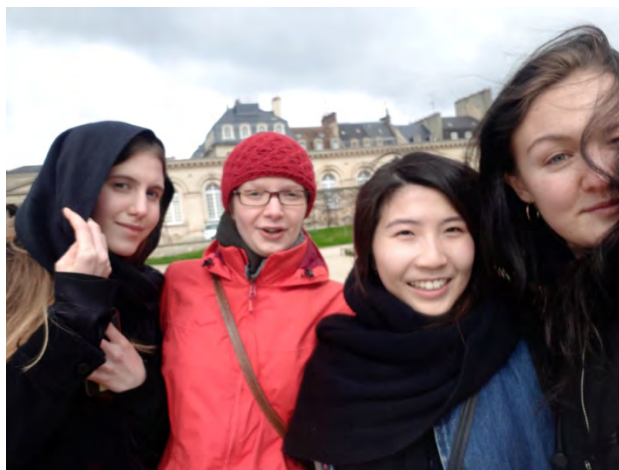
跟我比較好的歐洲交換學生 一起去 cean