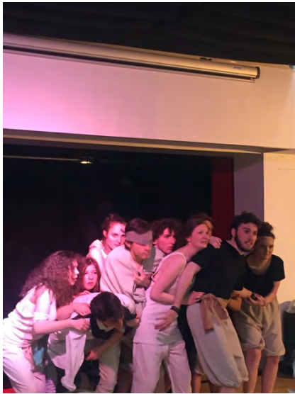
德國交換學生在 icp 演辛巴達冒險記