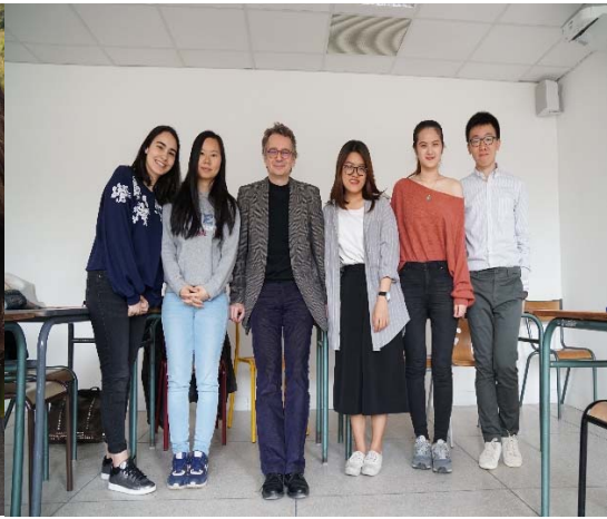
期末和授課老師的合照