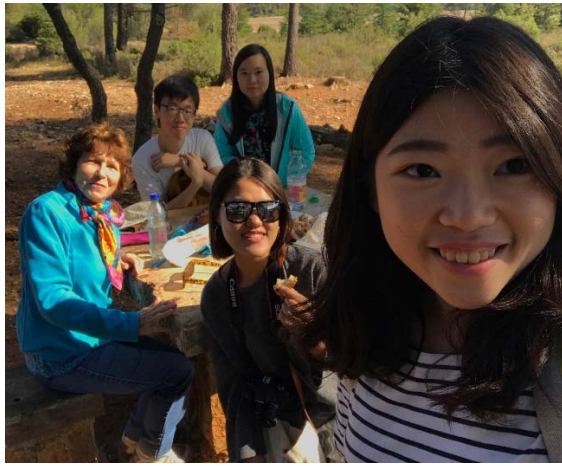
和接待家庭一起去野餐