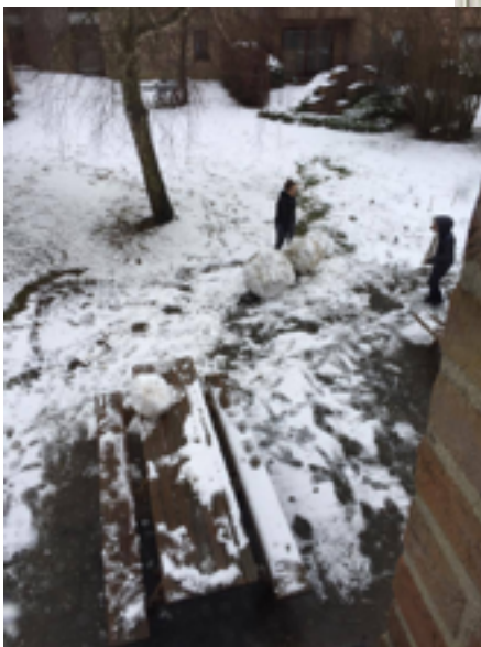
課外活動剪影：左下為宿舍室友打雪仗、堆雪人的情景， 中間為我和室友們一起去聽學校音樂會，右上則是廚藝 突然「開竅」後做的晚餐。