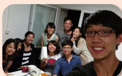
很會料理的日本女孩