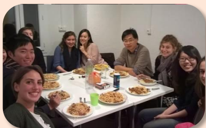
義大利朋友煮道地的義大利麵