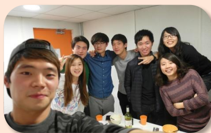
韓國友人的饅頭餐會