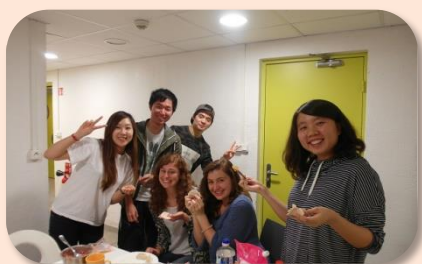
法國、韓國朋友體驗包水餃

「廚房」可說是我在法國的交誼廳。在這個小天地中，我認識了許多來自不同國家的學生，也結交到了許多好朋友。我們一邊煮飯、一邊談天，分享各自的料理、各自國家的文化，偶爾也一同用餐。我們曾和韓國朋友一起吃著辣炒春雞，玩各種不同的燒酒遊戲；和日本朋友一起做章魚燒、豬排丼；和法國朋友一起包水餃、做可麗餅；和義大利、西班牙、法國朋友一起傳著夾白菜；和德國朋友一起喝酒。在這個小空間中，留下了許多話語、留下許多笑聲，也留下了許多美好的回憶。