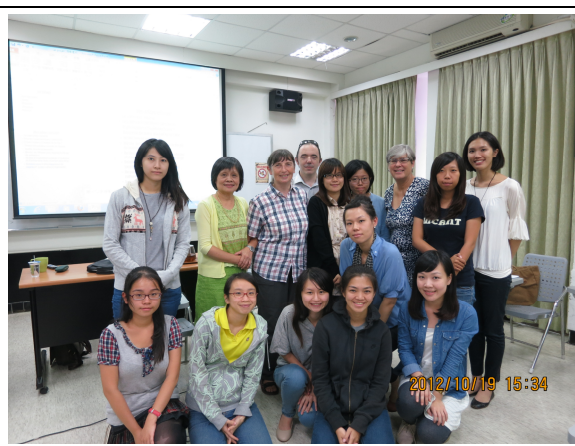
照片 10 說明：與課師生合照