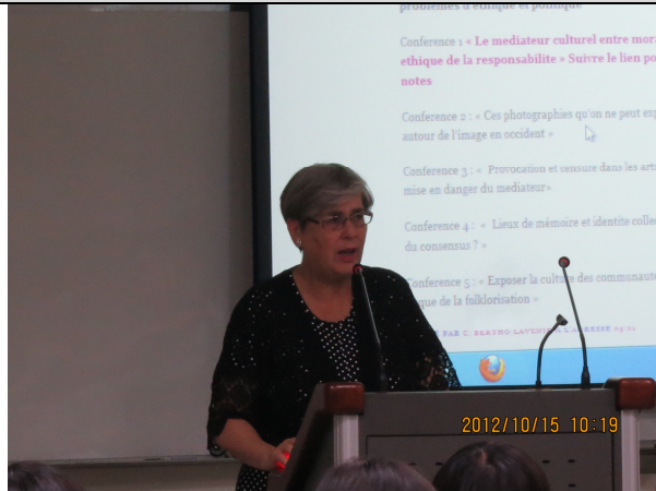
照片 1 說明：專題演講(一)