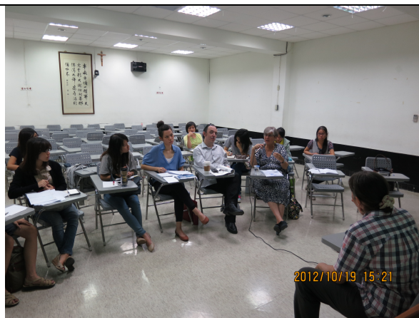
照片 9 說明：與學生座談