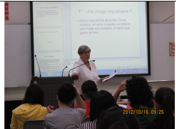
照片 3 說明：專題演講(二)