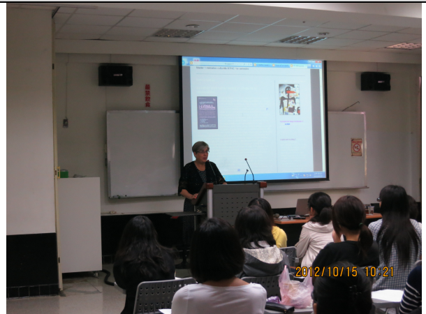
照片 2 說明：專題演講(一)