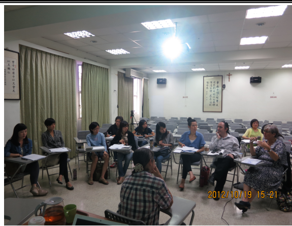
照片 8 說明：與學生座談