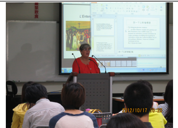
照片 4 說明：專題演講(三)