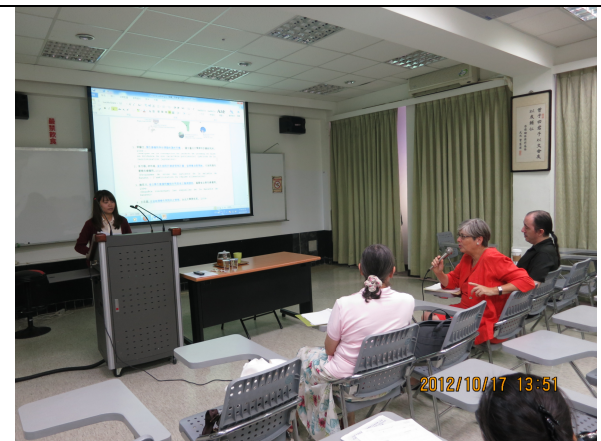
照片 5 說明：學生專題報告與評論