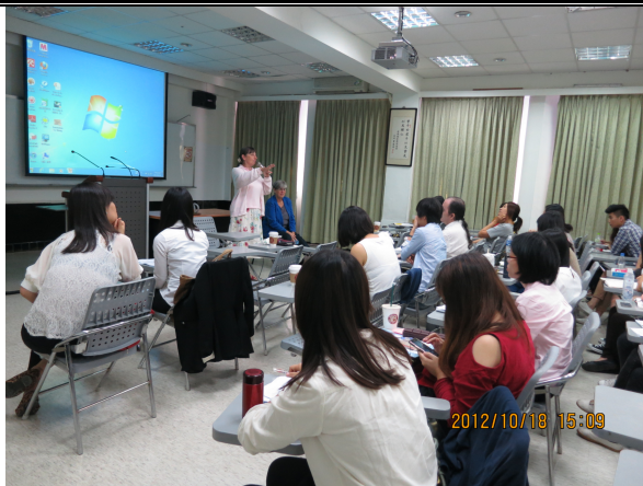
照片 7 說明：學生專題報告與評論