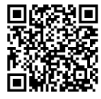
輔大平面圖 及立面圖下載