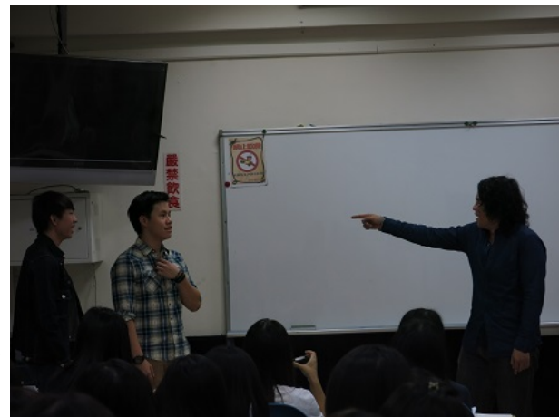
同學分組演出文本內容

雖然這是BONNEFOY第一次參加共教共學計畫，但這並不是她第一次教亞洲學生。她說：「在艾克斯-馬賽大學，我是語言中心的老師，所以平常班上就有來自各國的學生。」對於共教共學，她也說：「這計畫不僅對輔大法文系很重要，對我而言，這也是非常重要的體驗。」