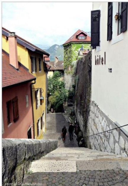
← 好喜歡這種羊腸小徑，→ 或許會有精靈跳出來！