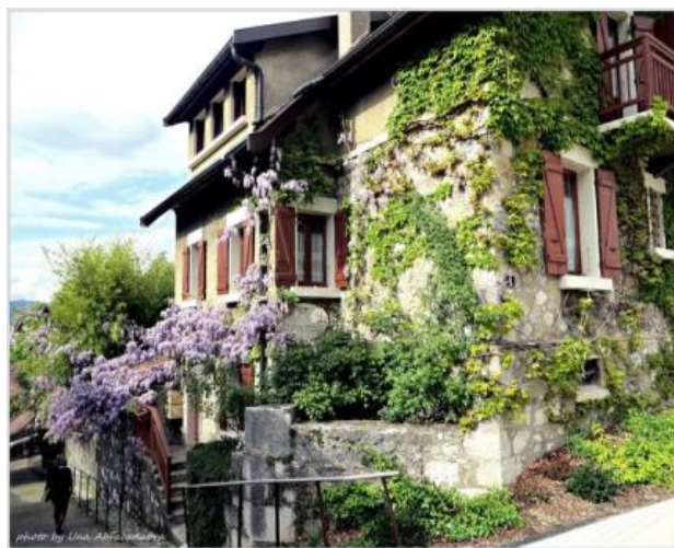
←前往安納西城堡途中 這個美麗的民宿