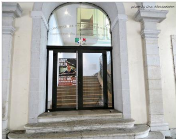
←安納西音樂學院 Conservatoire National d'Annecy