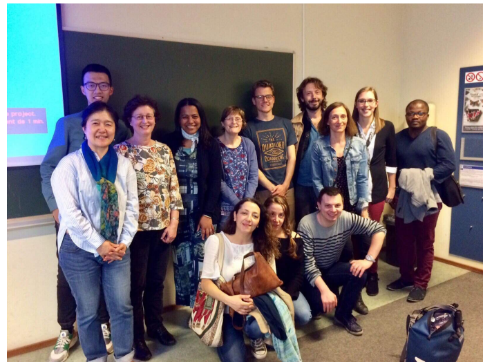
語音學課程結課合影留念