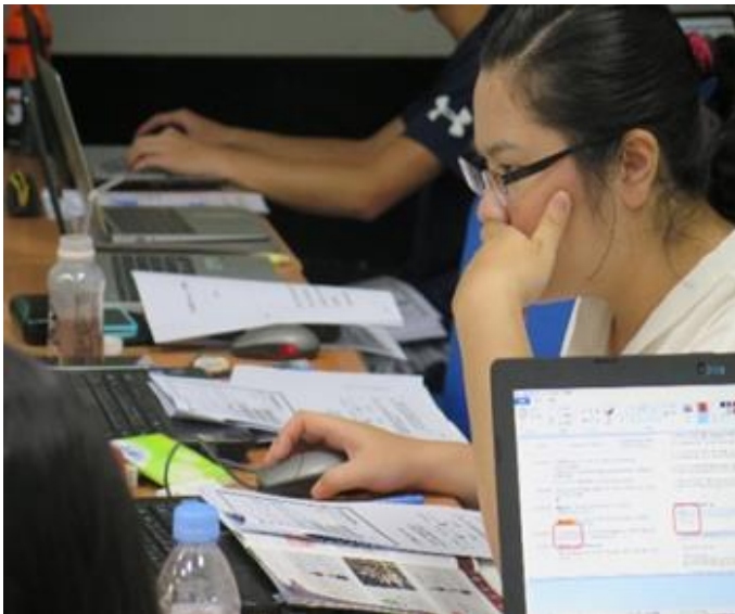
學生專注實務操作