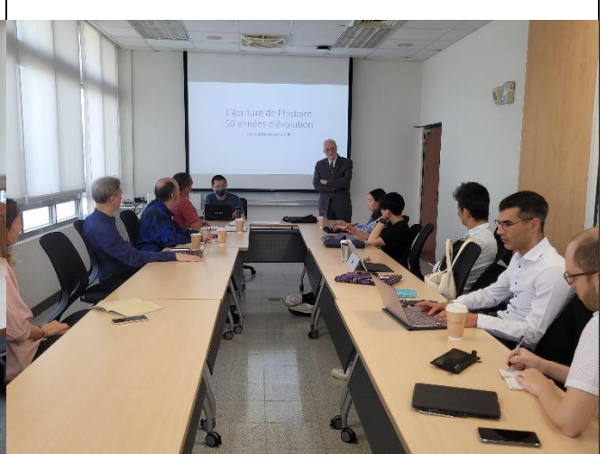
專題演講及教師研習工作坊