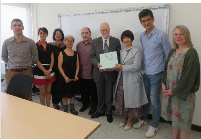
學術合作交流會議