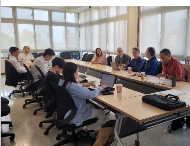
專題演講及教師研習工作坊